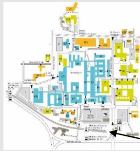
Haupteingang Carl-Neuberg-Str. 1

Mit der Bahn : Die Züge der Deutschen Bahn halten am Hauptbahnhof in Hannovers City. Ein kurzer Fußweg (ca. 5 Minuten) in Richtung Innenstadt bringt Sie zur Haltestelle Kröpcke. Dort nehmen Sie die Stadtbahn Linie 4 in Richtung Roderbruch. In etwa 18 Minuten erreichen Sie die Haltestelle Medizinische Hochschule. Nachdem Sie die Schienen überquert haben, befinden Sie sich vor dem Hauptgebäude der MHH. Dort befindet sich auch der Pförtner, der Ihnen gerne weiterhilft.